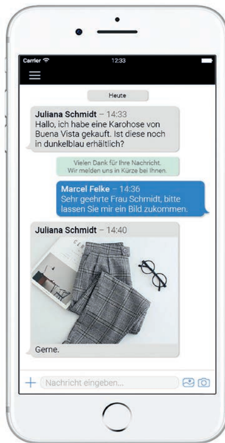
Neu: die Chat-Funktion, ideal fürs Homeshopping.

Weitere News: Weiterempfehlungen über Social-Media-Kanäle, aus denen sich Neukunden ergeben, können nachverfolgt und via App belohnt werden. Auch QR-Code-